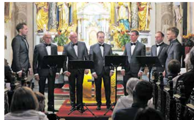
Šenturški oktet

Z letošnjim koncertom klasične glasbe je Šenturški oktet zaokrožil dvajsetletnico delovanja.