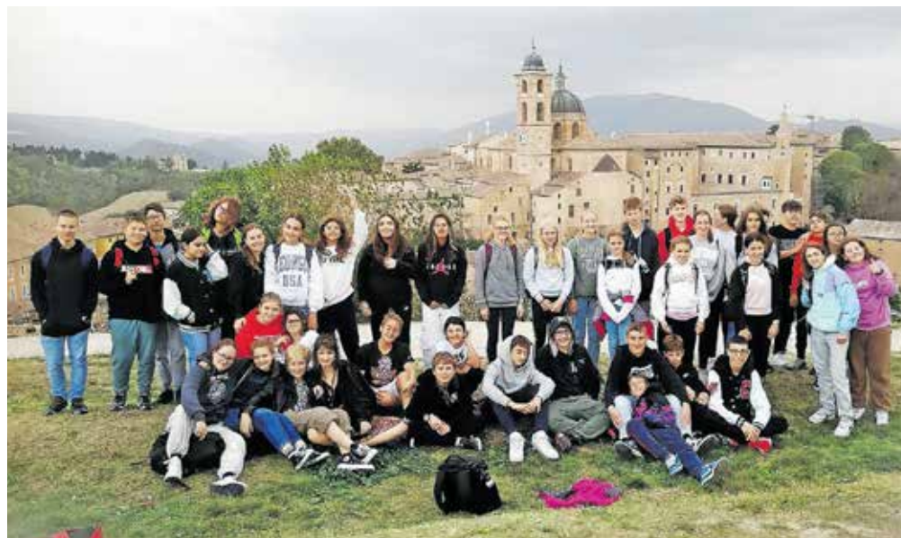
Z novimi prijatelji / FOTO: ARHIV ŠOLE

Konec marca bodo učenci iz Tavullie gostovali v Cerkljah. Obiska svojih »twinov« se učenci iz Cerkelj zelo veselijo, saj so se v sedmih dneh, kolikor je trajala mobilnost v Italiji, spletile prave prijateljske vezi.