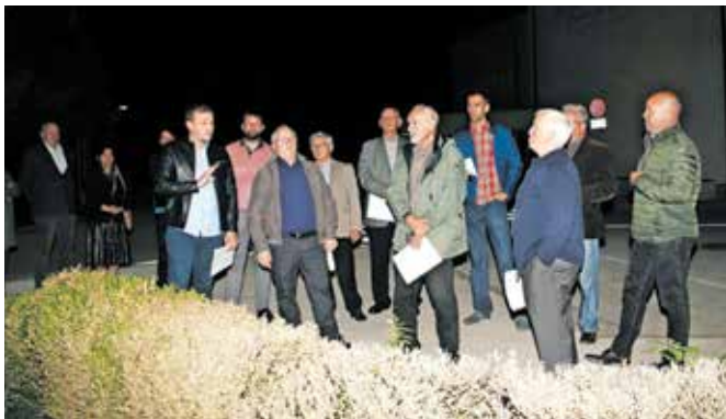
Poklon pevcev pred cerkljansko osnovno šolo