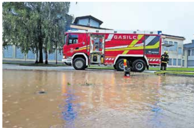
Ob avgustovskih poplavah

GZ ima v načrtu za leto 2024 tudi nakup dodatnih črpalk večjih zmogljivosti za črpanje ob poplavah.