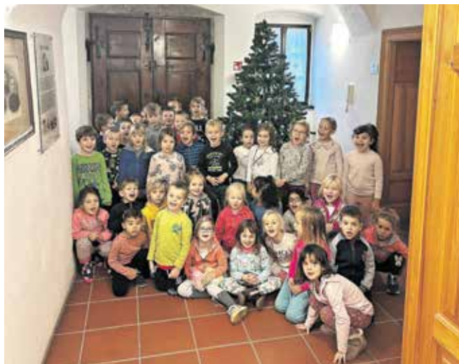
Novoletno jelko v Petrovčevi hiši so okrasili otroci iz Vrta Murenčki (Veverice in Medvedki). Okraske so izdelali sami, uporabili so storže in lesene palčke za sladoled.