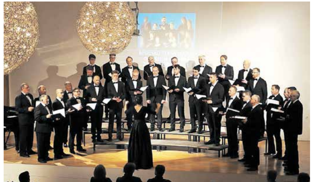
Komorni moški pevski zbor Davorina Jenka na regijskem tekmovanju