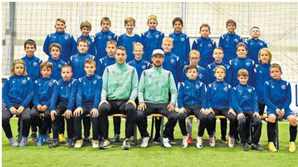
Mlajši dečki s trenerjema

Nadaljuje se tudi sodelovanje z NZS pri njihovem projektu razvoja otroškega nogometa in tako v letošnjem šolskem letu nadaljujemo program vpeljevanja nogometnih uric v vrtcih v Cerkljah in Zalogu, kar se je na obojestransko veselje pokazalo kot zelo dobra ideja. Od vsega nas najbolj navdušuje dejstvo, da je v nogometnem klubu tako v tekmovalni kot v vadbeni proces vključenih že več kot dvesto otrok iz Cerkelj, ki se navdušujejo nad igranjem nogometa, in zato smo se še toliko bolj veseli, da je naša občina razumela naše potrebe po novih igralnih površinah in začela investicijo iz-