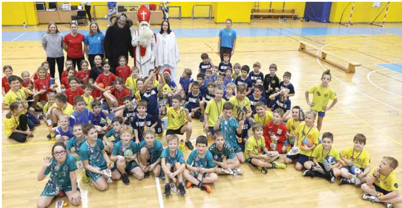
Najmlajši rokometiši ob prihodu Miklavža

mini rokometu, ki ga v klubu uspešno vodita Petra in Eva Kuralt. Tokrat je bilo prisotnih devet gorenjskih ekip, po igranju rokometu pa je vse prisotne obiskal še Miklavž. Vsem rokometnim zanesenjacom, zvestim sponzorjem in občanom Rokometni klub Cerklje želi uspešno in zdravo leto 2024 in ne pozabite spremljati evropskega prvenstva v rokometu v Nemčiji, ki se bo začelo 10. januarja.