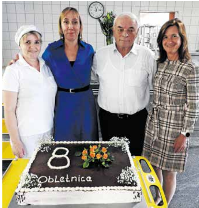
Pred razrezom torte, ki so jo naredili v domski kuhinji

Župan Franc Čebulj se je zahvalil za skrb, ki jo izkazujejo zaposleni in prostovoljci, stanovalcem pa je zaželel zdravje ter čim bolj kakovostno in prijetno bivanje v