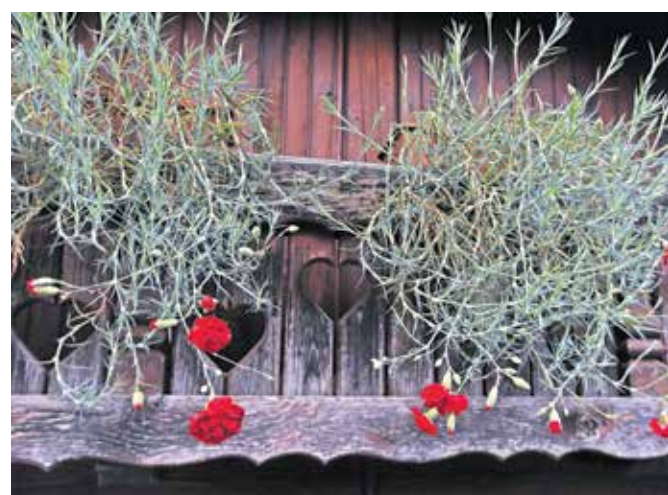
Občina Cerklje z delitvijo brezplačnih sadik spodbuja gojenje nageljnov.