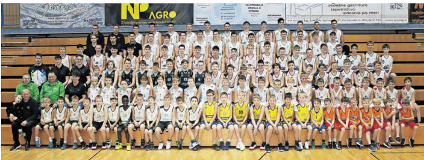
Košarkarski podmladek

začenjajo tekmovanja pod okriljem KZS. Prvi imajo nasprotnike v ekipah ECE Triglav, Jesenice in Stražišče Kranj, drugi igrajo z LTH Castingom Škofja Loka in ekipo Stražišče Kranj B, tretji pa z ekipami Domžale, Kansai Helios Domžale B in Komenda. Na povabilo direktorja šolske košarkarske lige Litve se bomo s tremi ekipami: U15 Europcar Krvavec, U13 Krva-vec Midalix in U11 Murnik-Petrofer Krvavec po dolgih štirih letih znova udeležili božičnih turnirjev v deželi košarke Litvi v Kaunasu. Na teh turnirjih igrajo tudi največje evropske ekipe iz Latvije, Estonije, Finske, Nemčije, Poljske, Češke in Litve. Ob koncu uspešnega leta se člani ŠD Krvavec zahvaljujejo našim potrpežljivim trenerjem, staršem, županu in Občini Cerklje, zvestim sponzorjem ter donatorjem, brez katerih zagotovo ne bi odigrali toliko tekem in doživeli veliko lepih trenutkov pod koši.