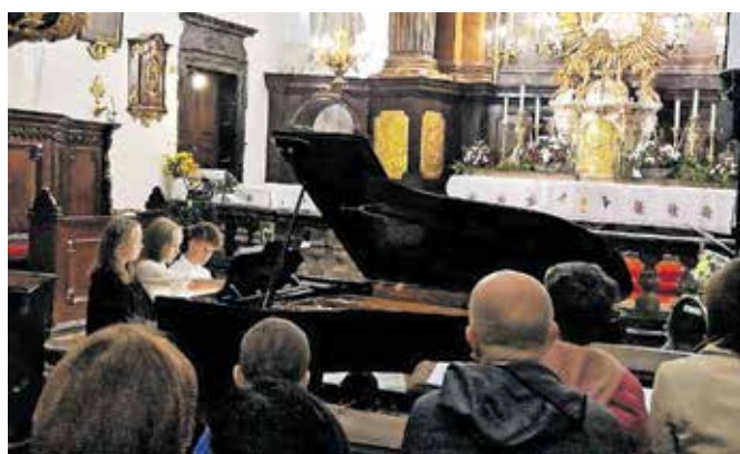
Nastop učencev Glasbene šole Kranj / FOTO: ARHIV LIONS KLUBA BRNIK

stovoljne prispevke v višini dobrih dva tisoč evrov so namenili za obnovo poplavljenih prostorov v cerkljanski šoli in Kulturnega doma Ignacija Borštnika. Še pomembnejša kot finančna podpora, pravijo v humanitarnem društvu, pa je solidarnost, ki je bila izkazana z obiskom prireditve in sodelovanjem nastopajočih, saj je bil motiv za organizacijo koncerta pokazati, da v stiskah stopimo skupaj, da ljudi v težavah ne pustimo samih.