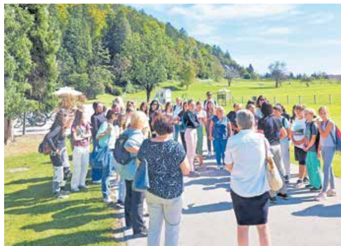
Obisk parka Strmol

Cerklje – Osnovna šola Davorina Jenka je že vrsto let članica mreže Unesco pridruženih šol (Unesco ASP mreža). Konec septembra se je pridružila praznovanju 70-letnice Unesca in 30-letnice Unesco mreže Slovenije, ki je potekalo v Biotehniškem centru Naklo. V popoldanskem času so Unesco šole z Gorenjskega gostile avtobuse, polne učencev, dijakov in mentorjev iz vse Slovenije. V Cerkljah smo sprejeli goste iz 14 mariborskih in osrednještajerskih šol, iz vsake šole po enega mentorja ter dva učenca. Želeli smo jim predstaviti povezavo s štajersko regijo. Najprej smo se ustavili pri Gradu Strmol, kjer so nam omogočili voden ogled notranjosti objek-