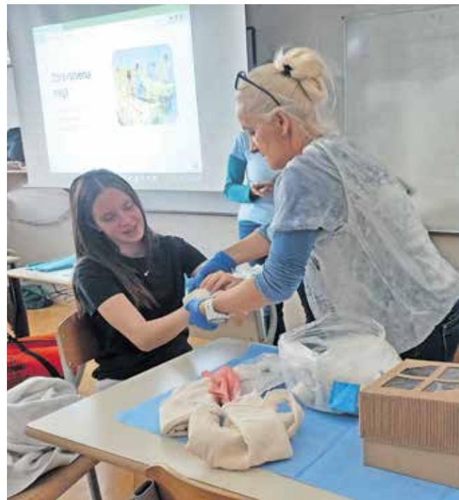
Učenci so spoznali tudi nekatere poklice v zdravstvu.

Na Osnovni šoli Davorina Jenka smo sredi novembra gostili predstavnike 28 različnih srednjih šol, večinoma iz gorenjske in osrednjeslovenske regije. K sodelovanju smo povabili tudi bolj oddaljene srednje šole, ki edine v Sloveniji izobražujejo za poklice s področja gozdarstva (Postojna), steklarstva in optike (Rogaška Slatina) ter pomorstva (Portorož). Zainteresirani devetošolci so lahko spoznali tudi srednješolsko izobraževanje onkraj naših meja, in sicer na Višji šoli za gospodarske poklice Št. Peter iz Avstrije. Mladostniki, ki si želijo med izobraževanjem pridobiti čim več praktičnega znanja, so prisluhnili predstavitvi Gospo-