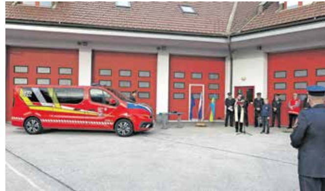
Slovesen prevzem novega vozila

v oktobru. »Najhuje je bilo seveda, ko je Slovenijo zajelo katastrofalno neurje. Enote naših gasilskih društev so začele posredovati že okoli dveh ponoči, ob šestih je bil aktiviran občinski štab Civilne zaščite, ki je nato več dni vodil intervencijo.« V uničujočih poplavah so po podatkih poveljnika GZ Cerklje Metoda Kroparja prejeli 336 prijav dogodkov, vodo so črpali iz 230 objektov. »Prvi dan, 4. avgusta, je bilo na terenu 13 gasilskih enot s 149 gasilci. Sodelovali so tudi gasilci iz notranjske regije, prostovoljci so pomagali polniti vreče s peskom. V naslednjih dneh smo število enot prilagajali potrebam na terenu, po umiritvi razmer pa so naše intervencijske enote nudile pomoč v sosednji občini Komenda in Lu-