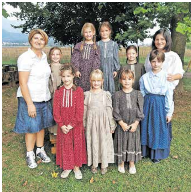
Otroška folklorna skupina z mentoricama

rabo materinščine. Leto 2023 je Generalna skupščina Združenih narodov razglasila za mednarodno leto prosa. V Sloveniji je bila prosena kaša nekdanj vsakdanja jed. Njegovo vračanje na njive in krožnike je pomemben prispevek k ohranjanju etno-