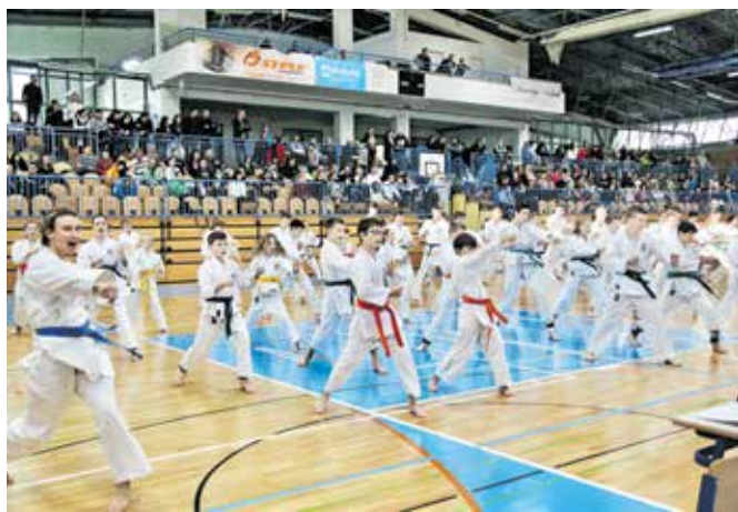
Ogrevanje tekmovalcev