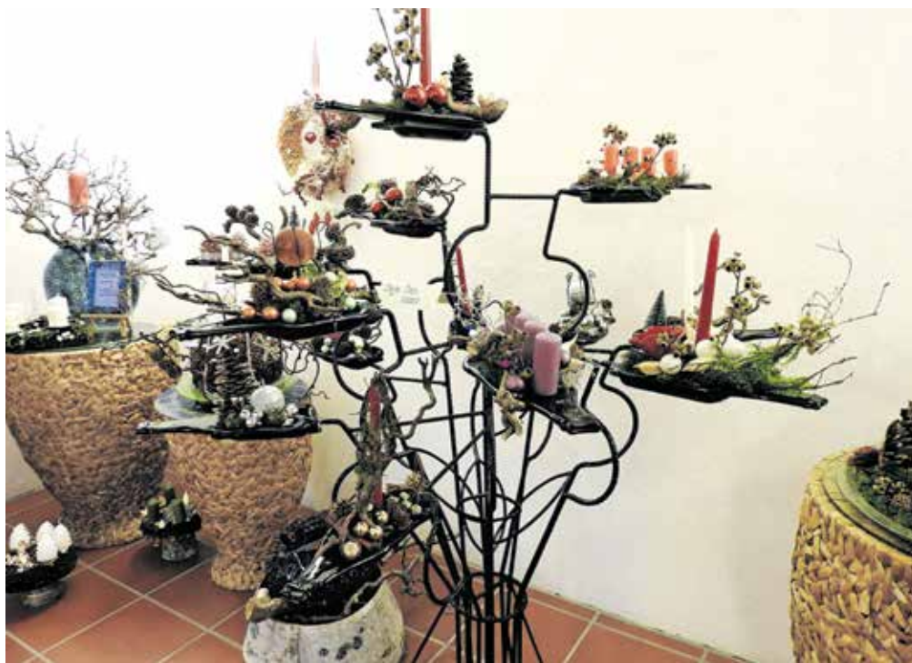
Delo Marjana Česna

Zavod za turizem Cerklje je sejem zaradi slabega vremena organiziral v Hribarjevi vili, sočasno pa je potekal še v prostorih osnovne šole, kjer so s svojimi izdelki mize obložili otroci. Vsem sodelujočim in obiskovalcem gre zahvala za nepozabno izkušnjo, ki smo jo soustvarili skupaj.