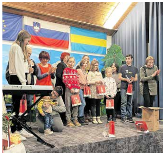
Sodelujoči na prireditvi Ta veseli dan kulture