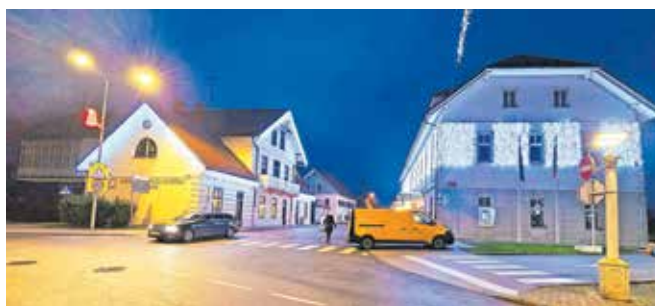
Cerklje so praznično podobo dobile 8. decembra.