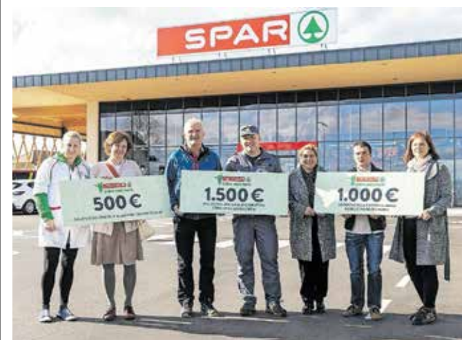
Ob podelitvi donacij

Trem lokalnim organizacijam je Spar Slovenija namenil donacijo v skupni višini tri tisoč evrov. Na podlagi glasovanja, h kateremu je povabil kupce, je polovico sredstev prejelo Prostovoljno gasilsko društvo Cerklje; namenilo jih bo za nakup nove gasilske opreme. Tisoč evrov je podjetje prispevalo za sanacijo po poplavih v Osnovni šoli Davorina Jenka, s petsto evri pa je podprlo nakup pripomočkov za vodene delavnice v Družinskem in mladinskem centru Cerklje.